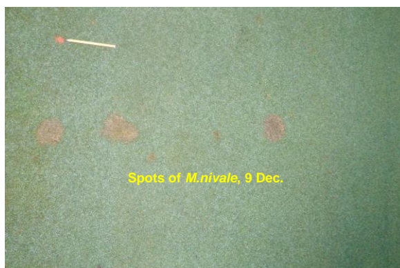
Spots of M. nivale , 9 Dec.