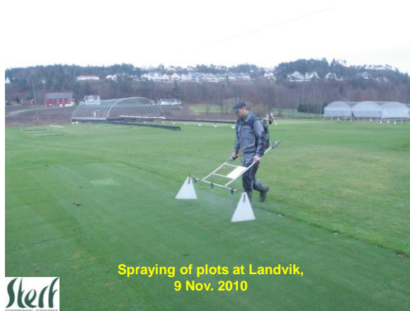
Spraying of plots at Landvik, 9 Nov. 2010