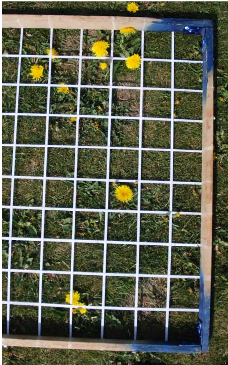
Feltramme til registrering av ugras.