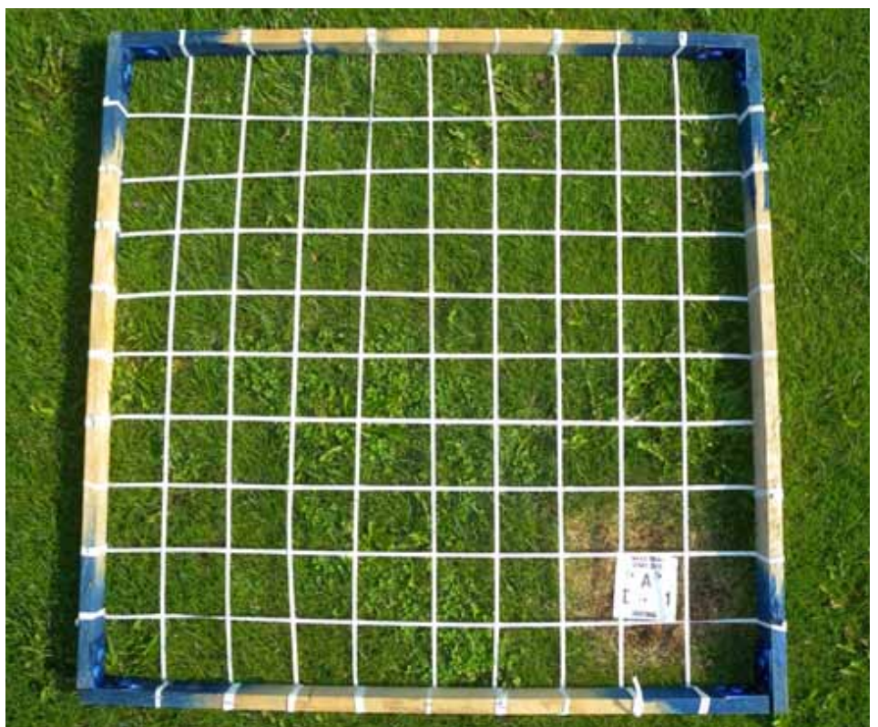
Feltramme til registrering av ugras.

Rammen kan kastes ut tilfeldig et bestemt antall ganger eller det kan settes markeringer i gresset slik at det er mulig å komme tilbake til det samme feltet og registrere over en tidsperiode. Da kan man få et bilde av hvordan spesifikke ugrasplanter eller ugrasområder utvikler seg.