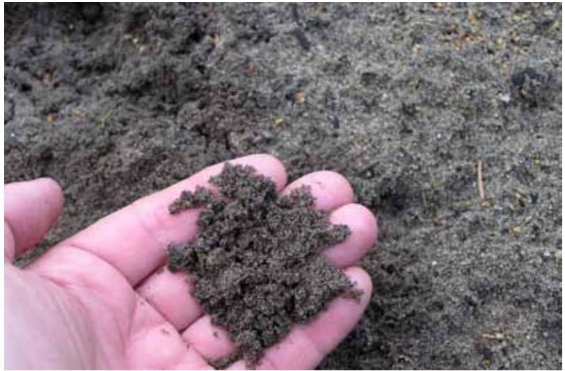
Bild 1. Mulldress (dress med organiskt material) ger bättre gröningsfuktighet där det är lite filt.

Dressing med sand som har ett högt innehåll av organiskt material («mulldress») är det bästa sättet att öka fuktigheten i torra fläckar som är svåra att etablera gräs i. Bra kompost är utmärkt, men är svårt att få tag i.