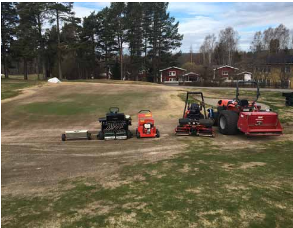
Bild 2: Test av såmaskiner på Sundsvall GK 3 maj 2016.

Det finns flera olika typer av dukar på marknaden. Greenkeeper Johan Örberg, Umeå Sörfors GK, mätte temperaturer under tre olika dukar som en del av sitt HGU-arbetet. Under en vecka i månadsskiftet maj – juni 2012 var