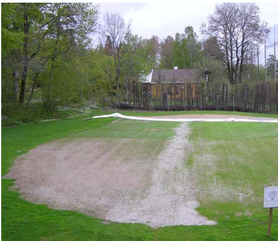
Bild 3: «Enklare» dukar (typ fiberdukar) kostar cirka 10 % av vad en mer «anpassad» duk för grönyta kostar. De skyddar frö mot tunga regndroppar och bibehåller fuktigheten som är nödvändig för groning. Lägga märke till den bättre groningen där duken låg. Denna bild är från ett försök på Vestfold golfklubb i Norge, där olika såtekniker testades på en död puttinggreen. Se Gressforum 2009/3